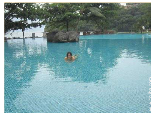
Piscina a desbordamiento

Bar exterior, mesa(s) de jardín, 2 silla(s) de jardín, sombrilla, área de jardín, 4 reposera(s), 4 tumbona(s), ducha exterior, WC exterior