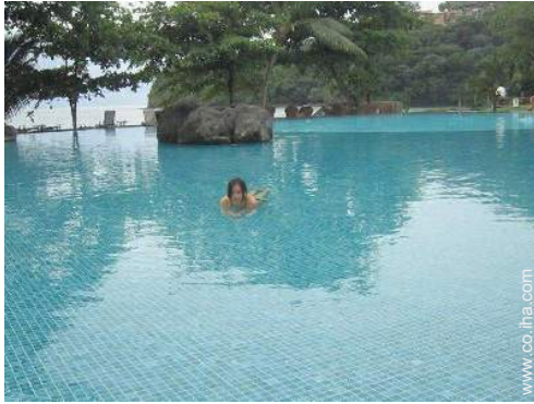
Piscina a desbordamiento