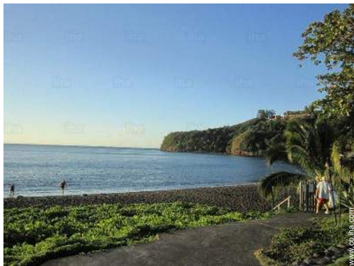
vista sobre el océano