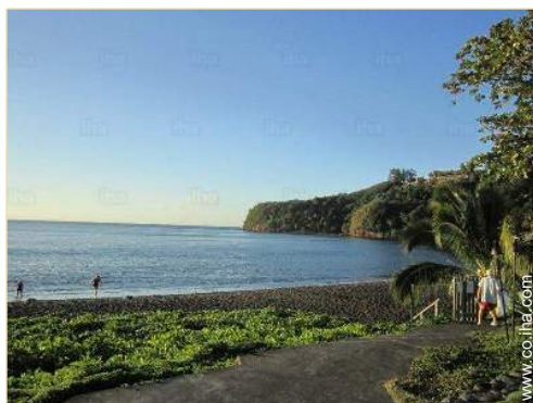
vista sobre el océano