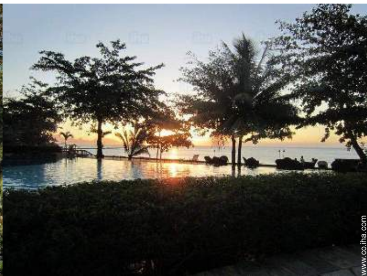
vista sobre la apuesta del sol