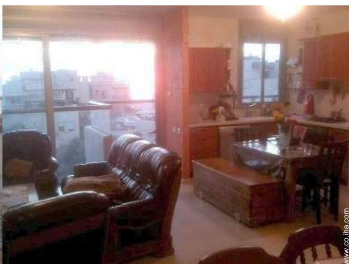
vista sobre el mar