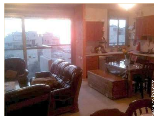
vista sobre el mar