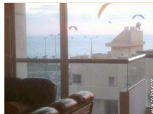
vista sobre el mar