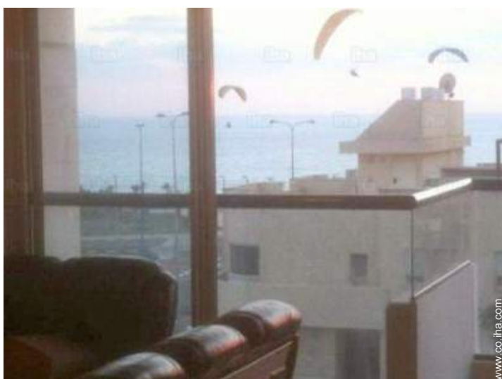
vista sobre el mar