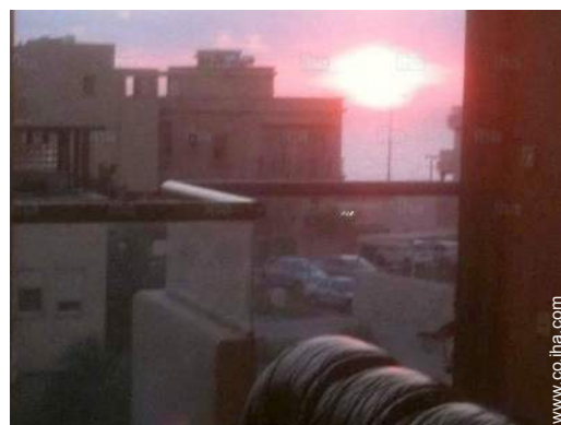
vista sobre el mar