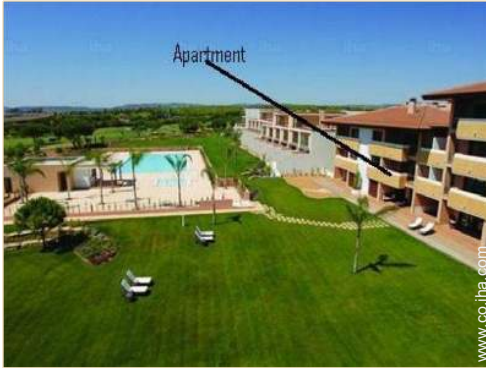
vista sobre el jardín/parque