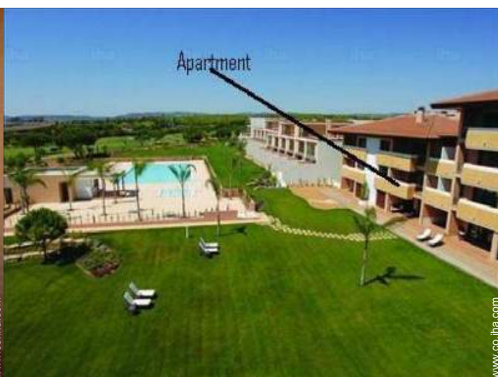
vista sobre el jardín/parque