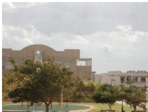
vista sobre el jardin/parque