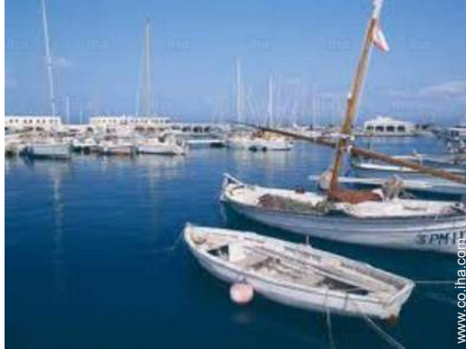
barco de vela