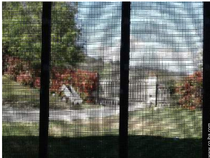
mosquitero de ventanas