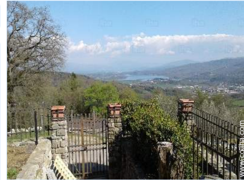
vista sobre el lago