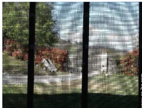
mosquitero de ventanas