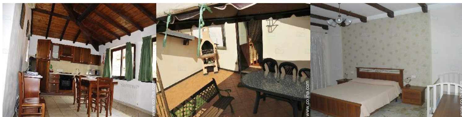
cama de matrimonio