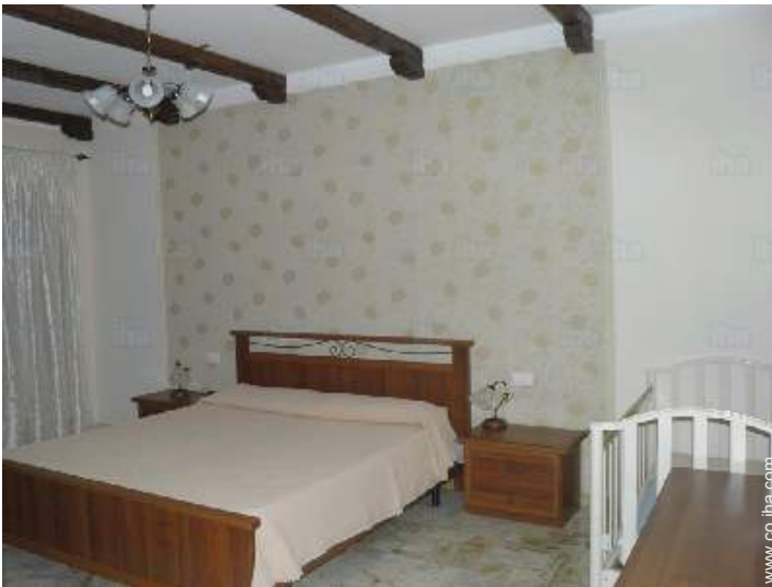
cama de matrimonio