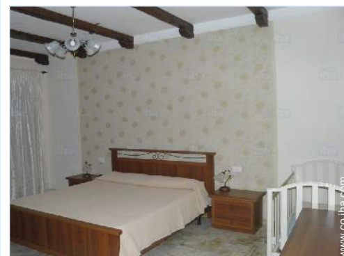
cama de matrimonio