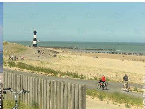
actividades balnearias cercanas