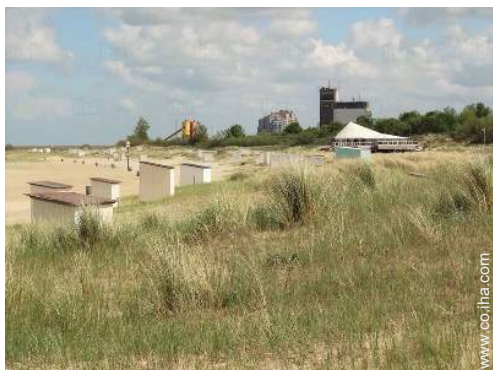
actividades balnearias cercanas