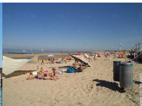
actividades balnearias cercanas