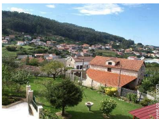
vista sobre el jardin/parque