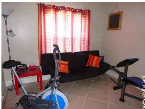
sala de deporte