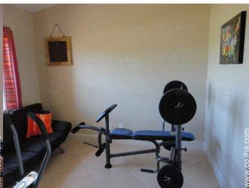
sala de deporte