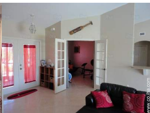
sala de deporte