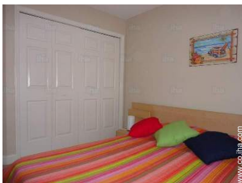
cuarto de invitados