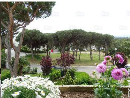
vista desde el apartamento