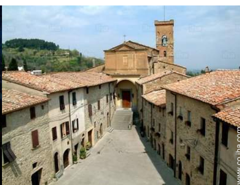
centro del pueblo