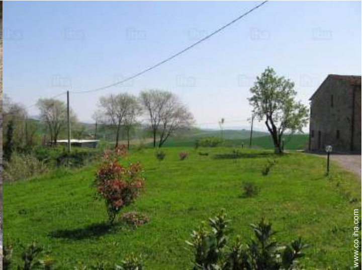
vista desde el jardin/parque