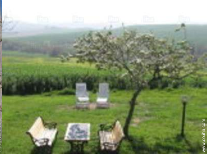
vista desde el jardin/parque