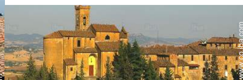
centro del pueblo