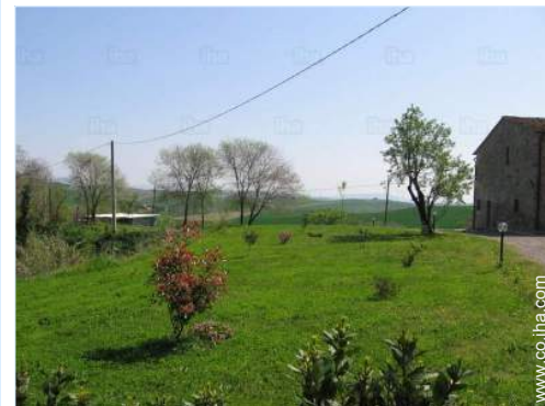
vista desde el jardin/parque