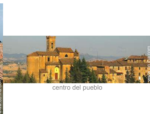
centro del pueblo