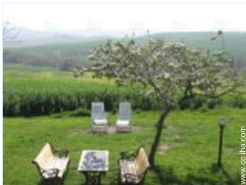
vista desde el jardin/parque