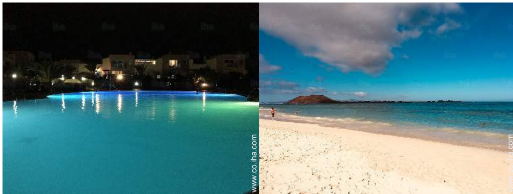
sistema de iluminación