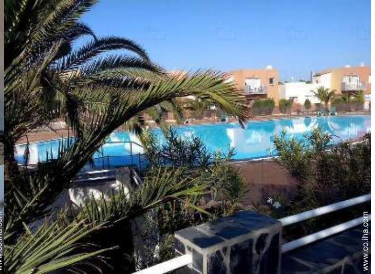
Piscina a desbordamiento