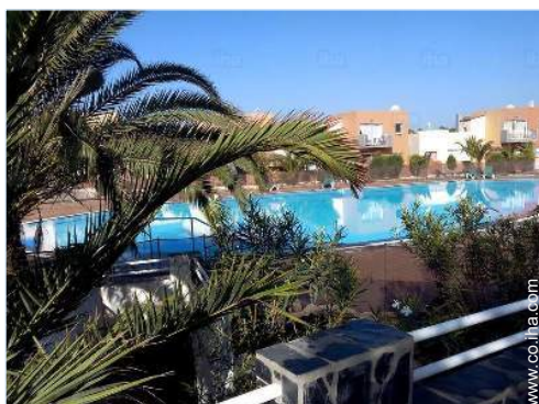
Piscina a desbordamiento