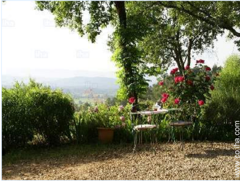
vista desde la casa