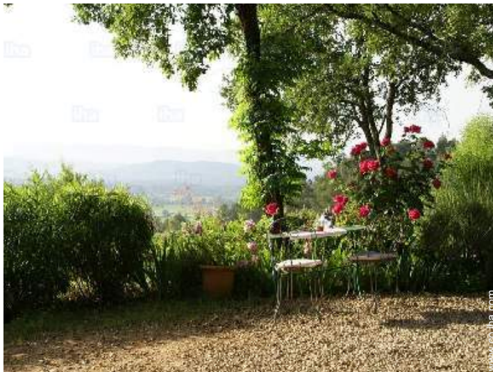
vista desde la casa