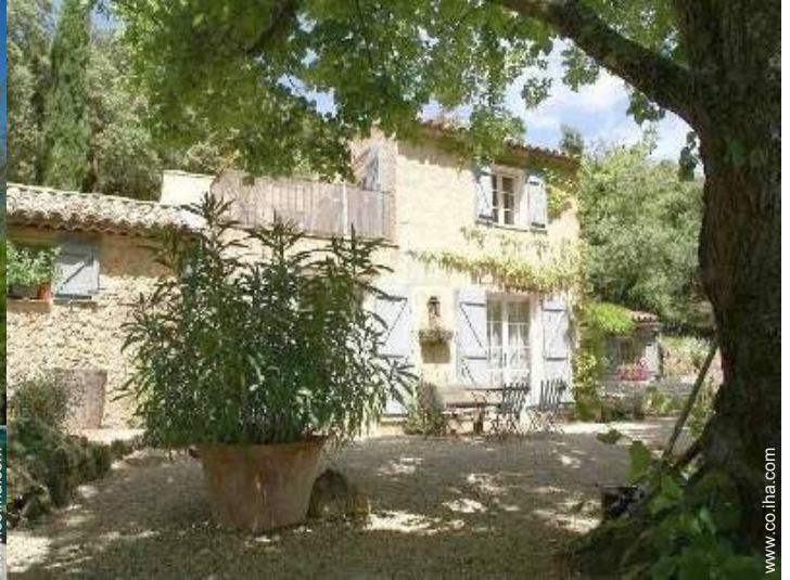
Propiedad con Encanto