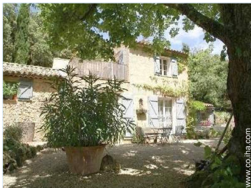
Propiedad con Encanto