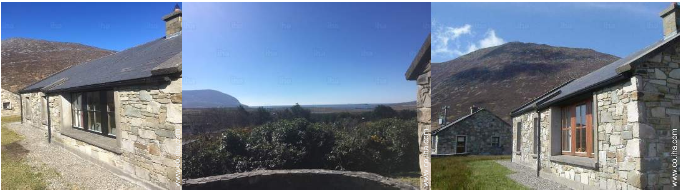
vista desde el patio