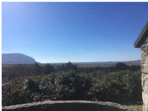
vista desde el patio