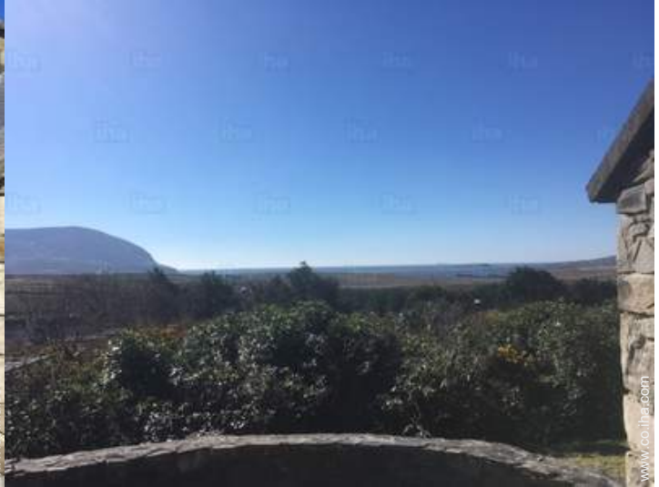
vista desde el patio