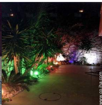
vista desde el jardín/parque