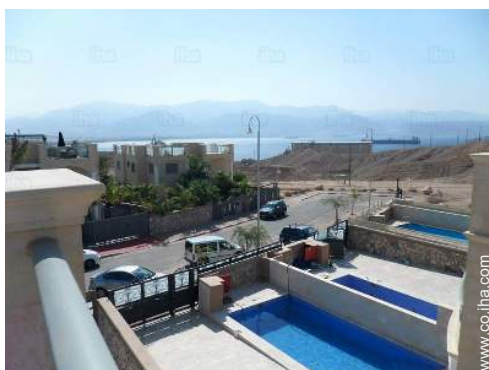
vista desde la casa