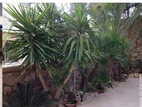
vista desde el jardín/parque