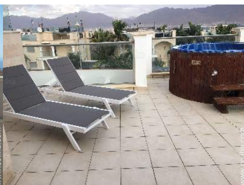
vista desde la azotea