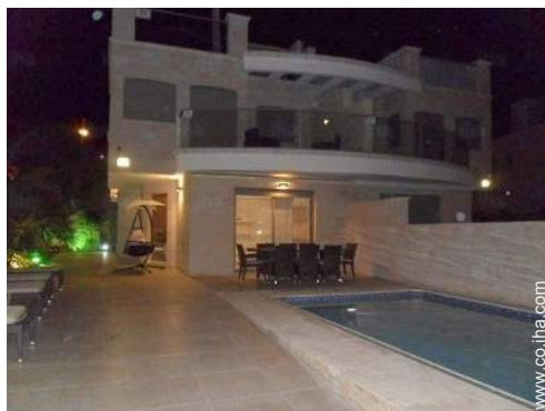
vista desde el jardín/parque