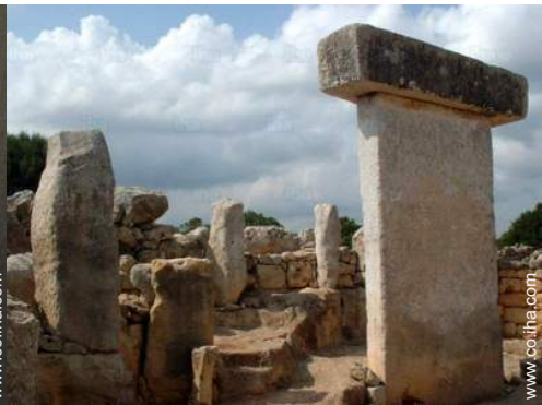
Zonas atractivas y relajación