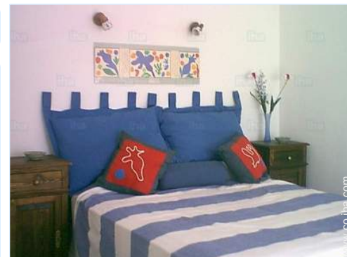
habitación del propietario

Parrilla, mesa(s) de jardín, 10 silla(s) de jardín, sombrilla, 4 reposera(s), ducha exterior