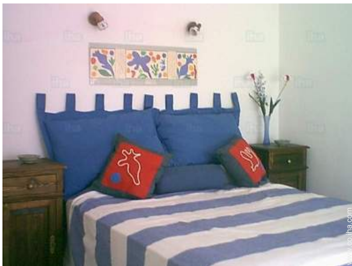
habitación del propietario