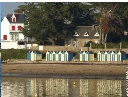
acceso directo playa