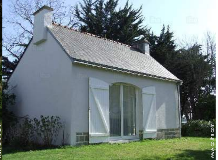
Marco exterior a disposición de los huéspedes