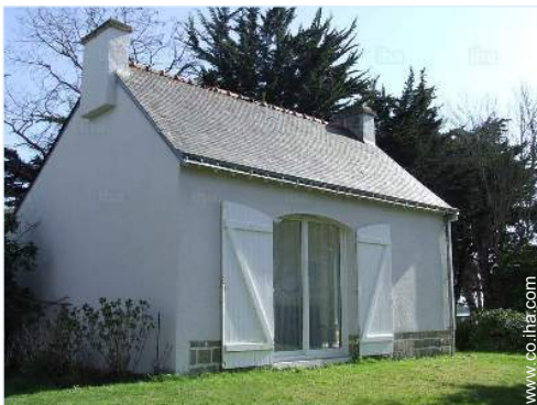
Marco exterior a disposición de los huéspedes