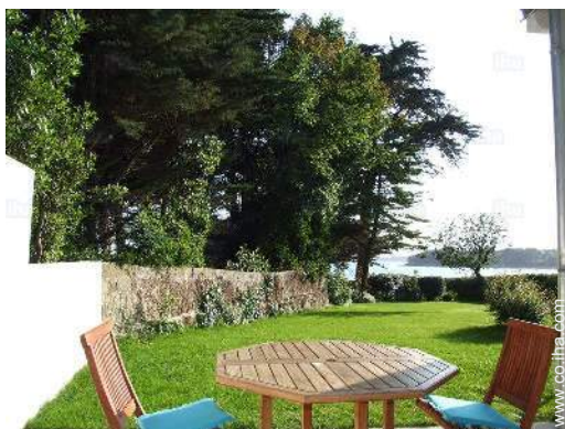
vista desde el dormitorio