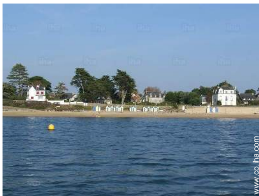
acceso directo playa