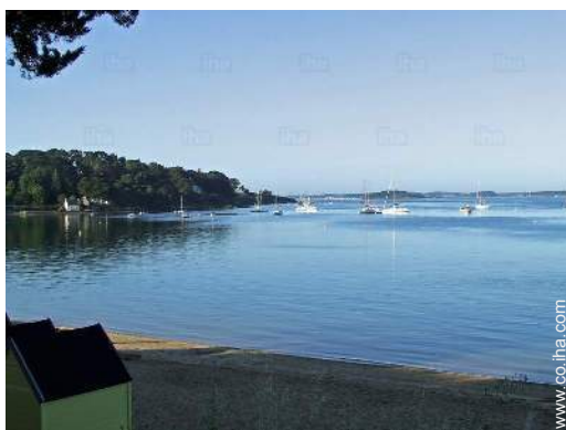
vista desde el jardín/parque