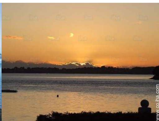
vista sobre la puesta del sol