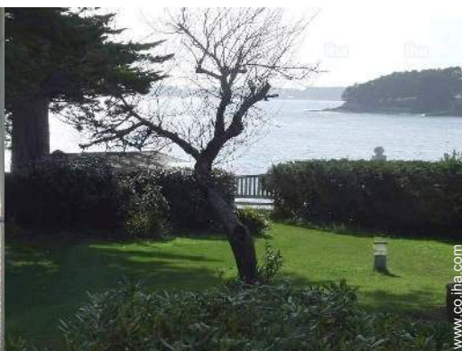
vista desde el salón