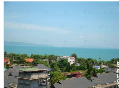
vista sobre el océano