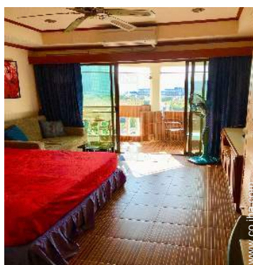
Confort interior e instalaciones