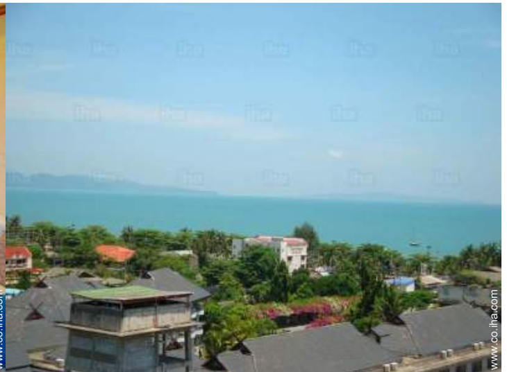
vista sobre el océano