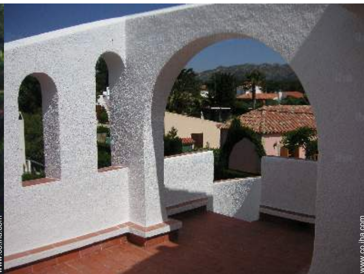
vista desde la azotea