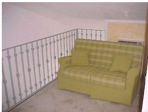
vista desde le entresuelo