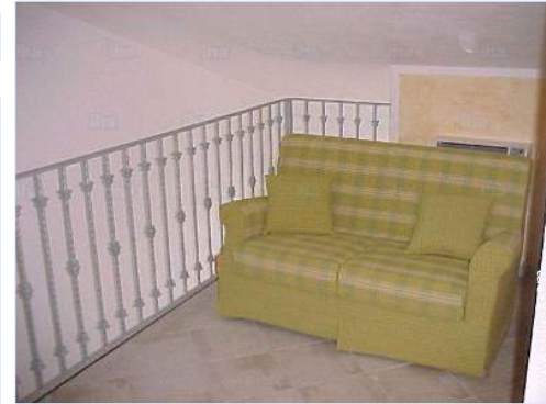
vista desde le entresuelo