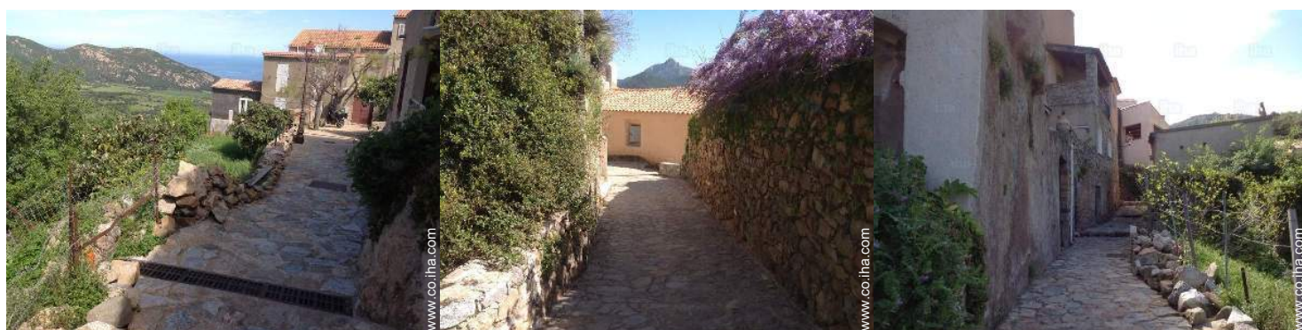
vista desde la casa