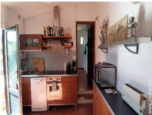
gran cocina independiente