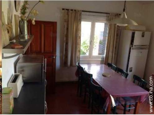
gran cocina independiente