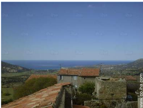
vista desde el dormitorio