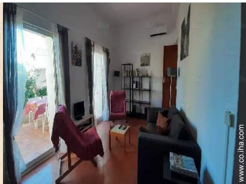
cuarto de estar