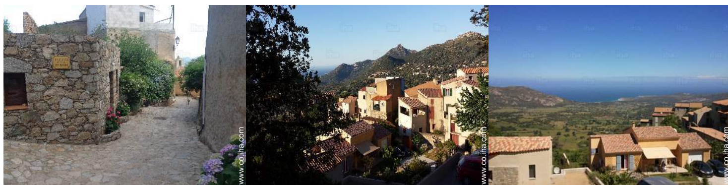
vista sobre el centro del pueblo