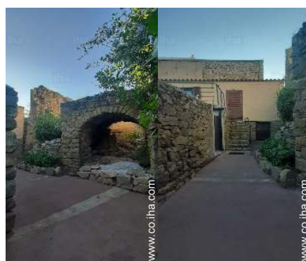
Casa de Pueblo