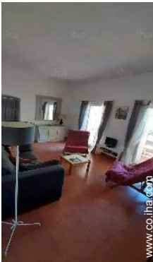
cuarto de estar