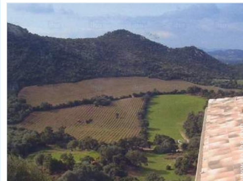
vista sobre viñedos