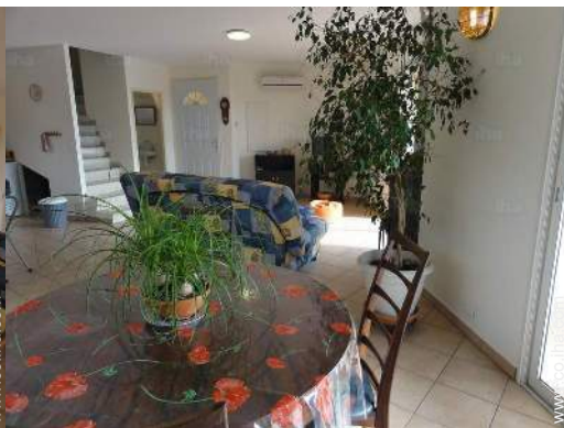
vista desde el salón