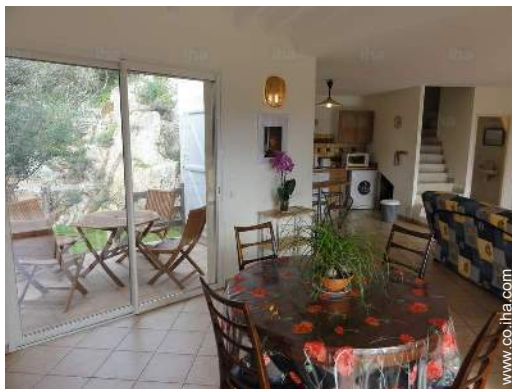
vista desde el salón