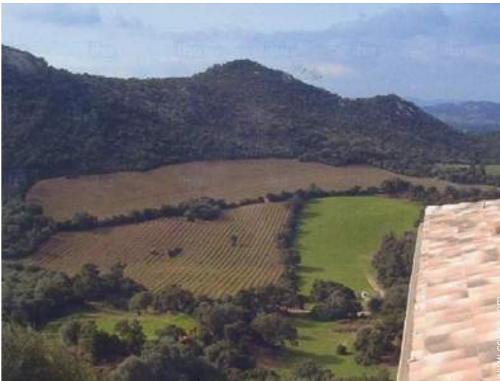
vista sobre viñedos