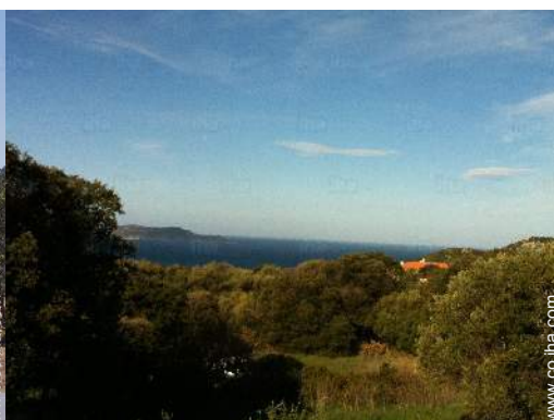
vista desde la casa