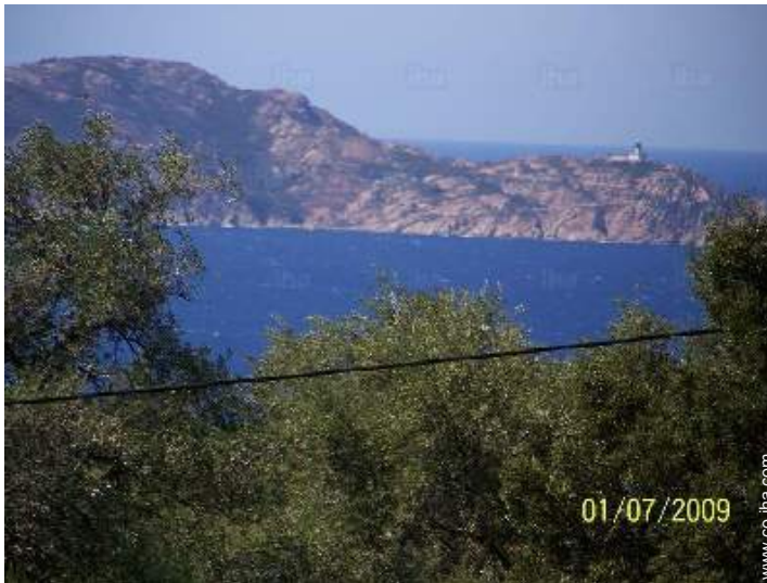
vista sobre el mar