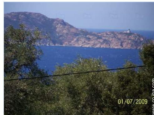
vista sobre el mar