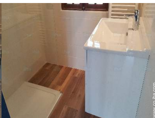
cuarto de baño