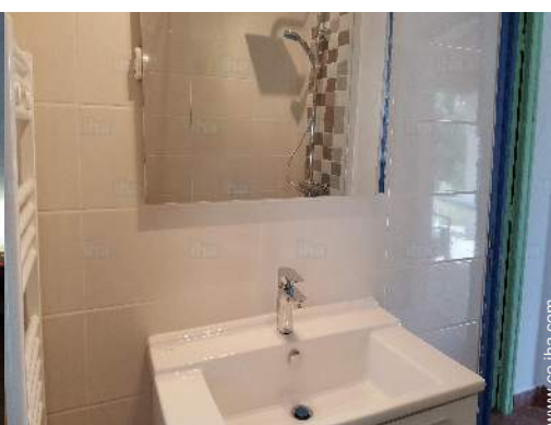
cuarto de baño