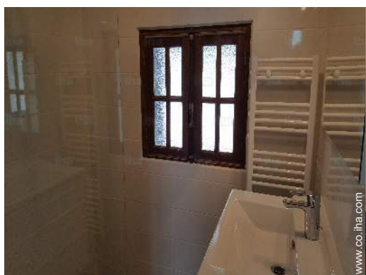
cuarto de baño