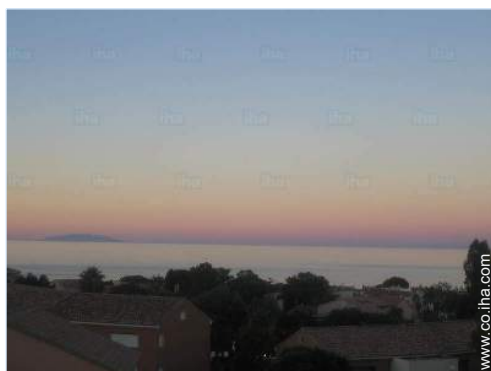
vista sobre el mar