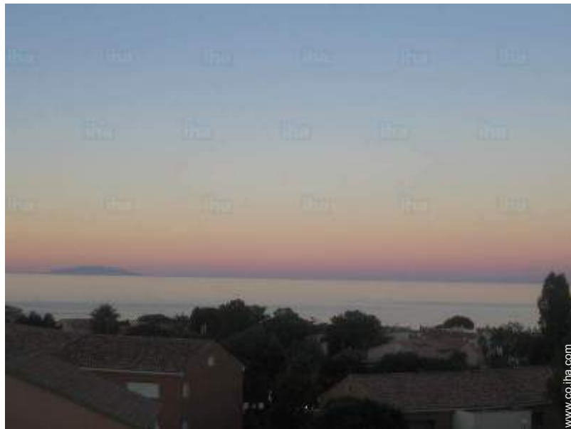
vista sobre el mar