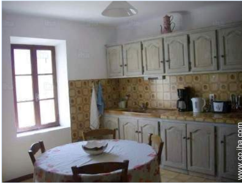
gran cocina independiente