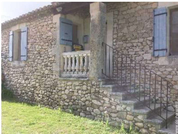
Casa de Piedra