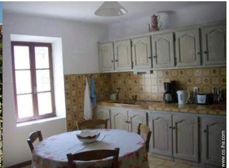
gran cocina independiente