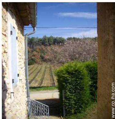
vista sobre viñedos