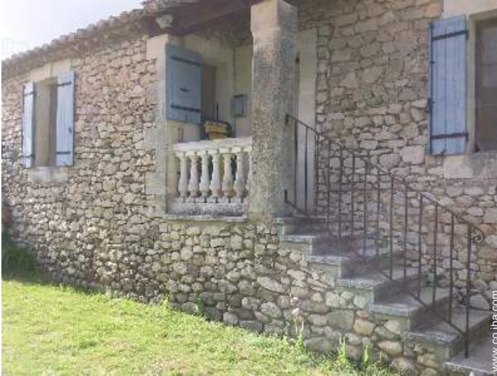
Casa de Piedra