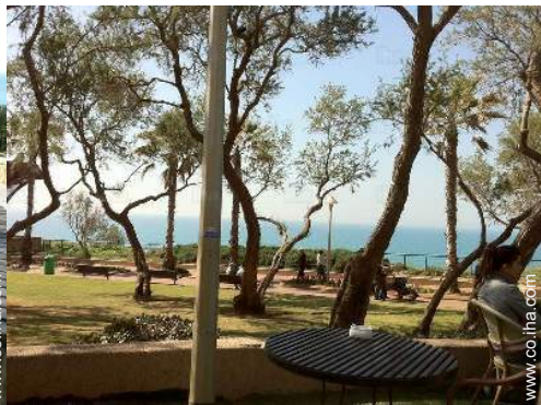
parque y jardin