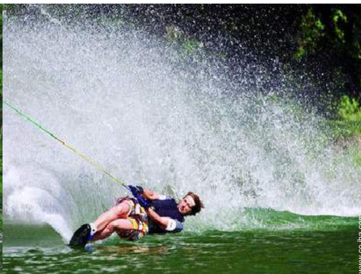
instalación de ocio