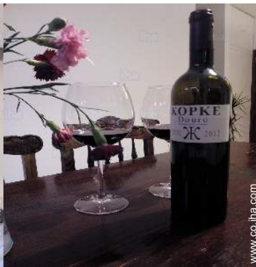
Presencia en el lugar