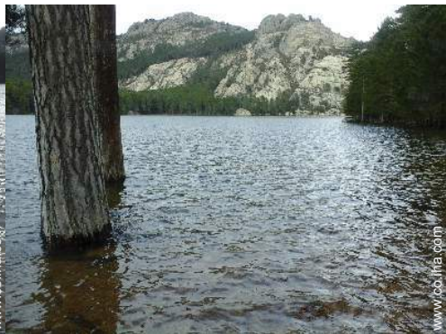
pesca con caña