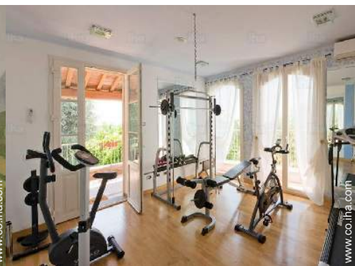
Instalaciones a disposición