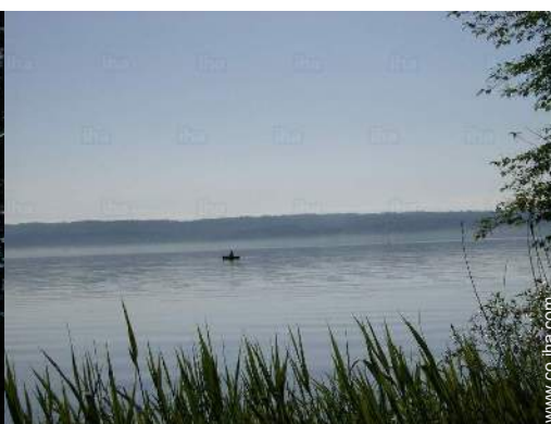
vista sobre el lago