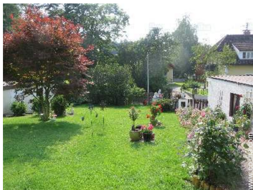
vista sobre el jardin/parque