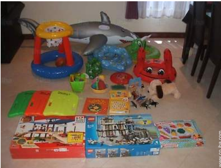
instalación de ocios