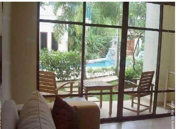
vista desde el dormitorio