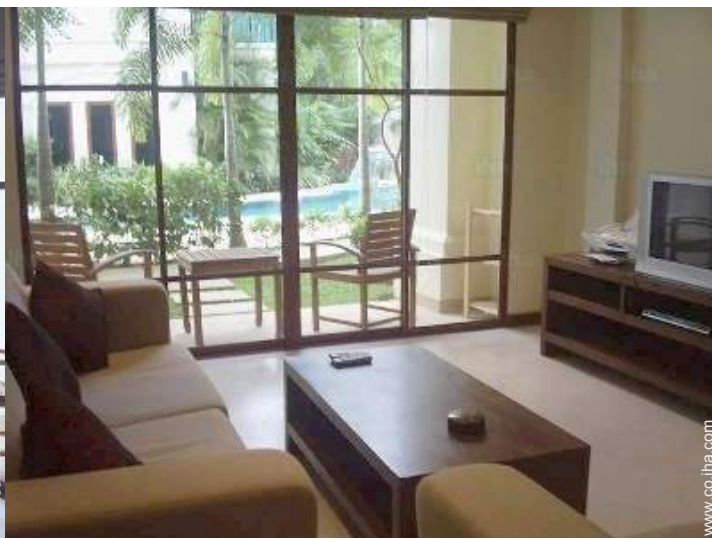
vista desde el apartamento