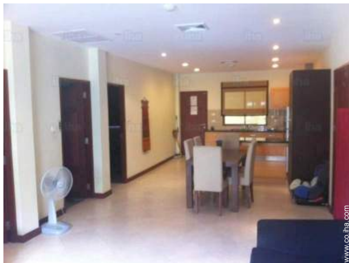
vista desde le comedor