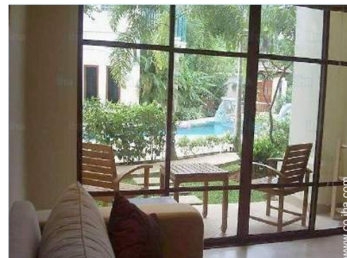
vista desde el dormitorio