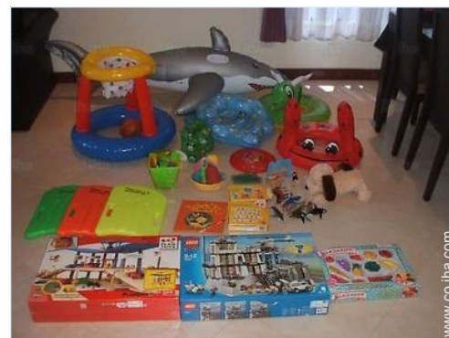
instalación de ocios

Alquiler de bici/MTB <50m Alquiler de moto/escúter 300m Alquiler de carro 300m Panadería 1km Pequeños comercios 500m Supermercado 1,5km Comercios de lujo y de marcas 5km Peluquería <50m Cibercafé 500m Correos 4km Banco 4km Cajero automático 200m Farmacia 300m Doctor 1km Hospital 5km