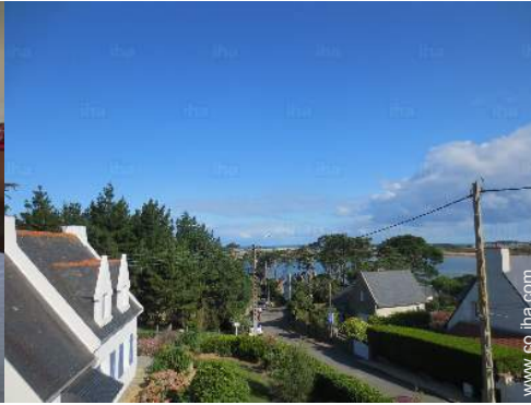
vista desde el dormitorio