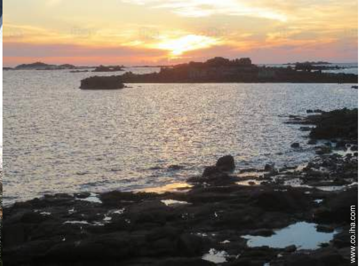
vista sobre la apuesta del sol