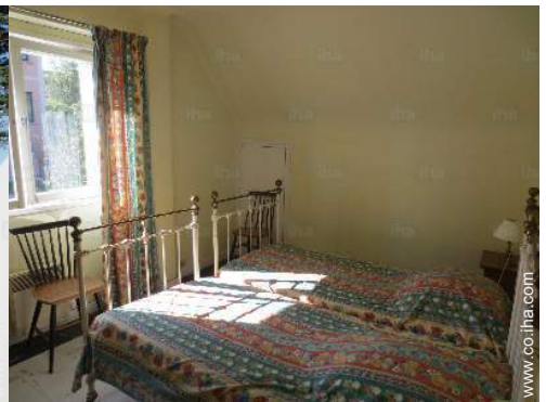
cuarto de invitados