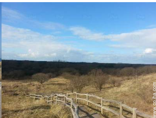
camino para pasear