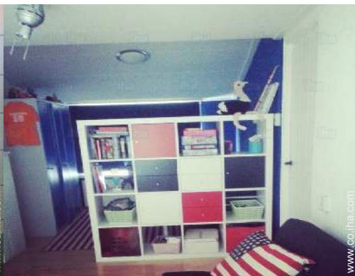
sofá cama 1 pers