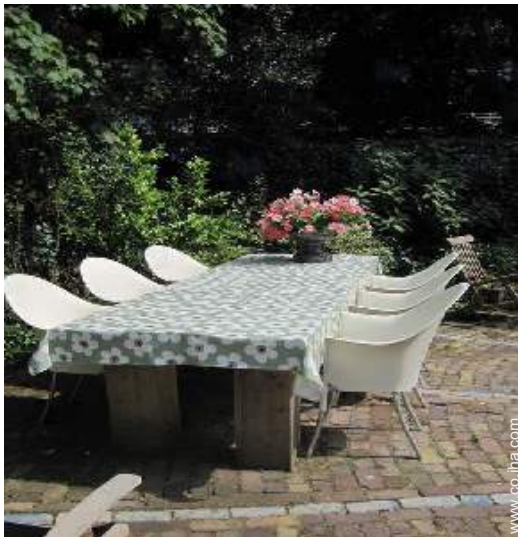
mesa(s) de jardín