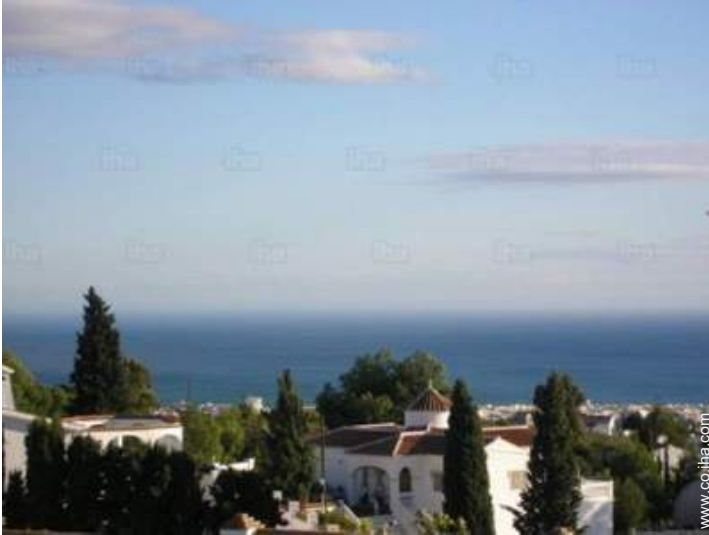
vista desde la terraza