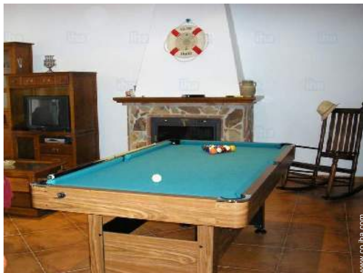
mesa de billar