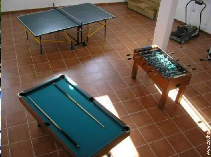
Instalaciones de ocio