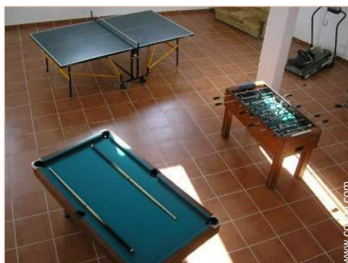
Instalaciones de ocio

Máquina(s) de musculación, mesa de billar, fútbolin, dardos, mesa de ping-pong, 2 raqueta(s) de ping-pong