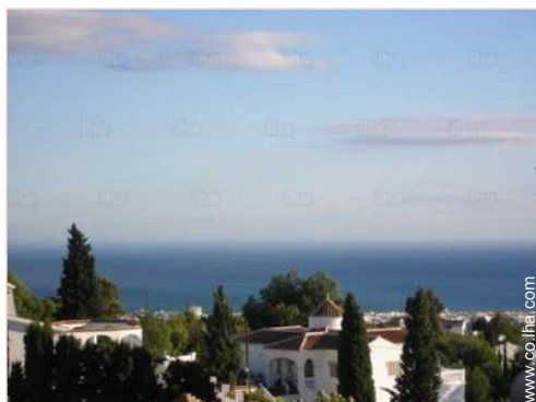
vista desde la terraza