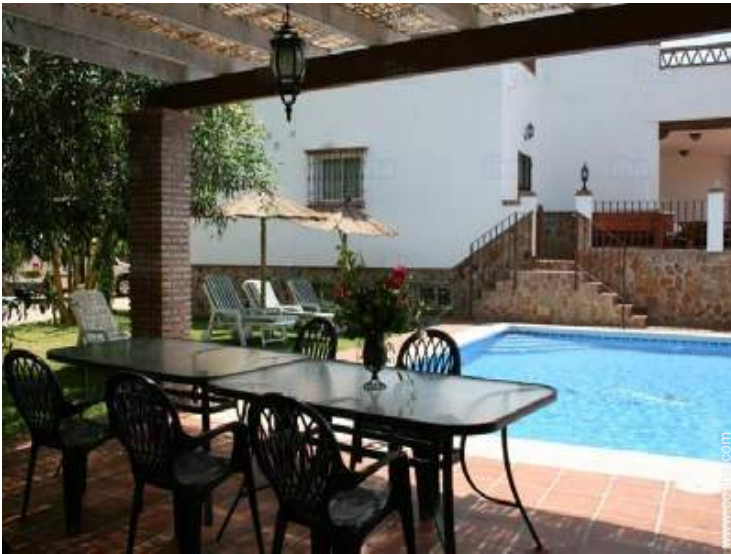
área de jardín