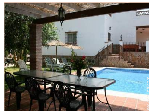
área de jardín