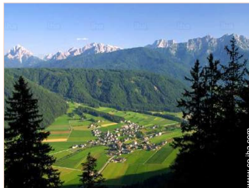
vista sobre el pueblo

Acondicionado para disminuidos : movilidad