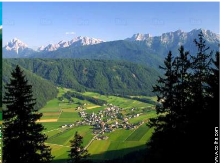
vista sobre el pueblo