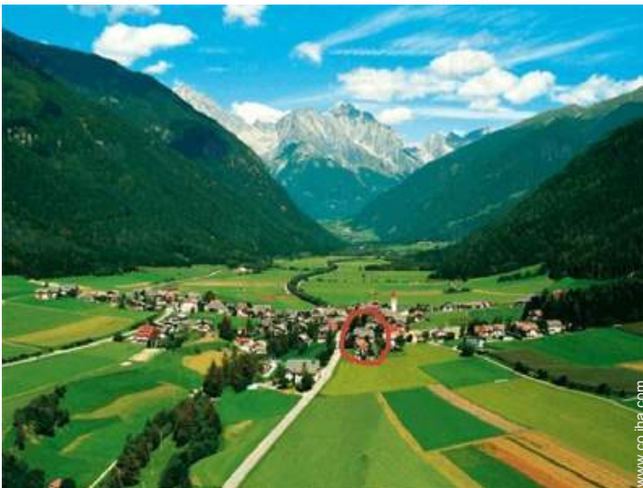
vista sobre el pueblo