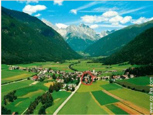
vista sobre el pueblo