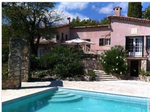
Casa Provençal con Encanto