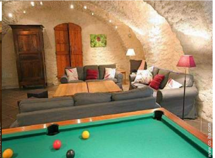
Instalaciones a disposición