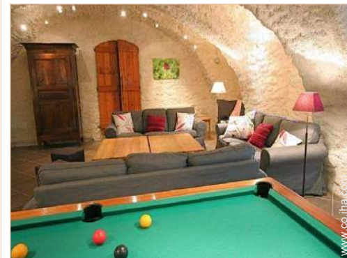
Instalaciones a disposición

Centro del pueblo Parada/estación de guagua