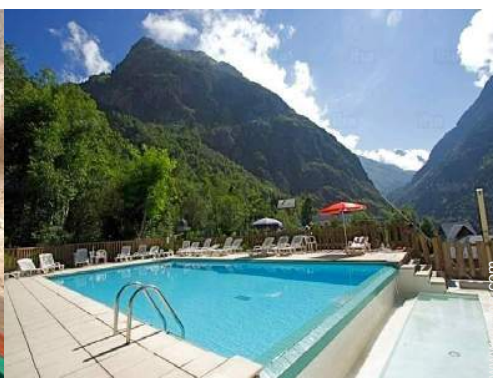
piscina en la residencia