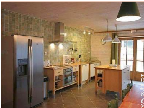
área de cocina