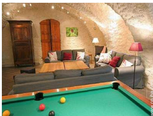
Instalaciones a disposición