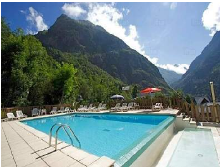
piscina en la residencia