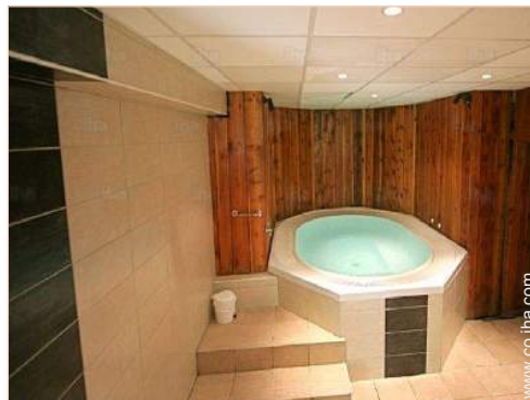
Instalaciones a disposición