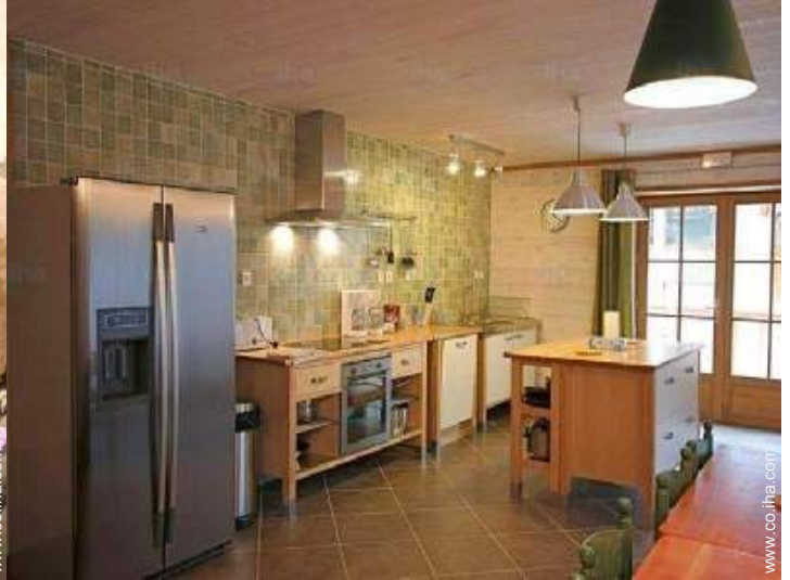
área de cocina