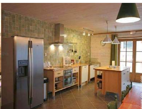
área de cocina