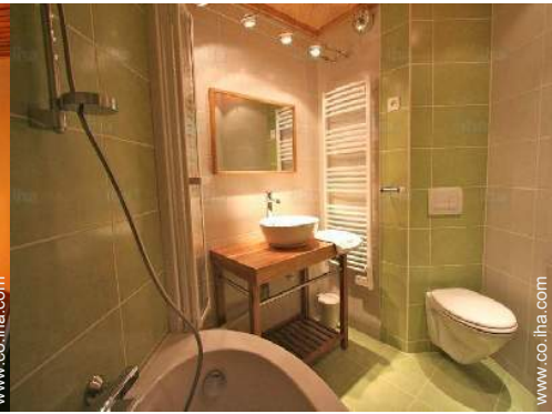
cuarto de baño