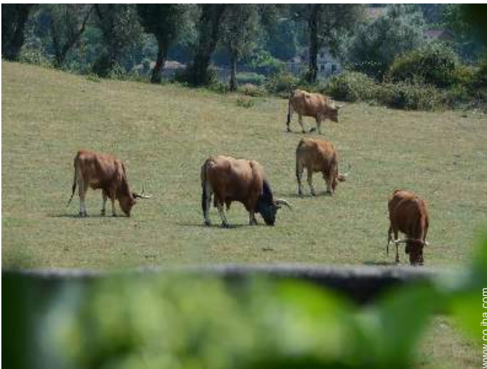
animales de la granja