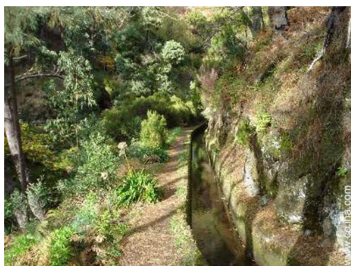
camino para pasear