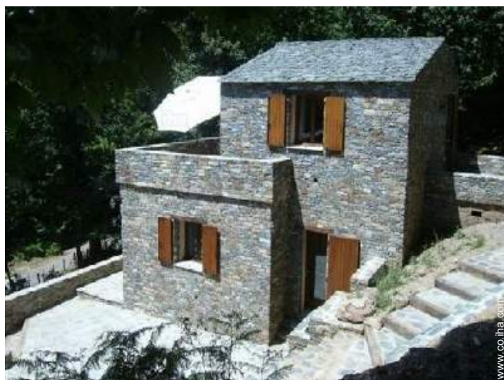
vista sobre la montaña