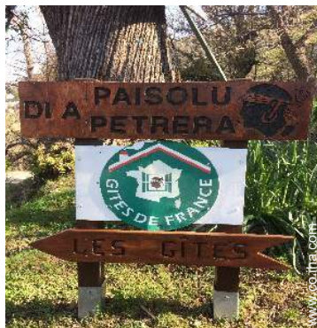
Presencia en el lugar