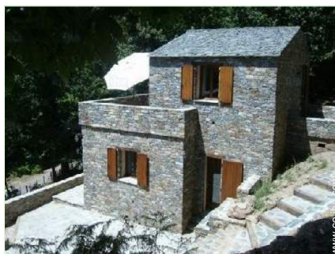
vista sobre la montaña