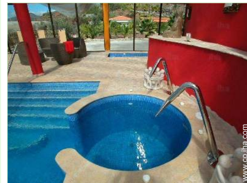
piscina en la residencia