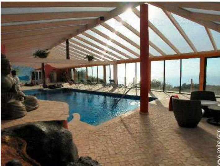
piscina en la residencia