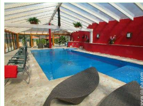
piscina en la residencia