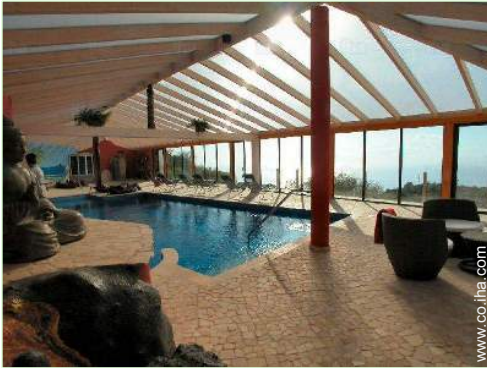
piscina en la residencia