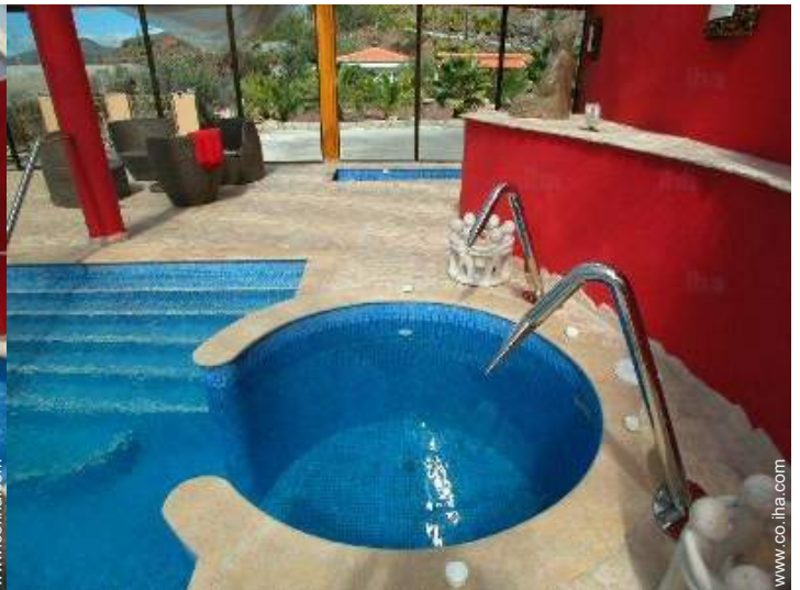
piscina en la residencia