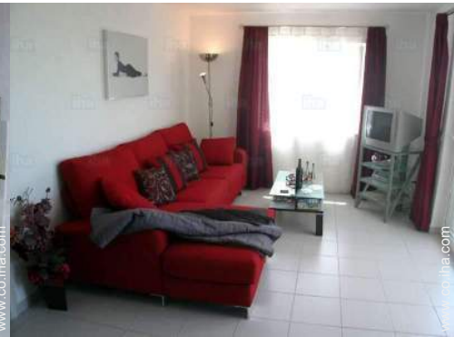
Confort interior e instalaciones