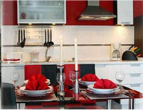
Disposición interior privado