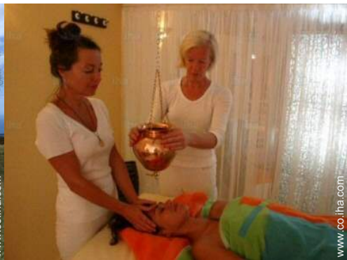
tratamientos de belleza