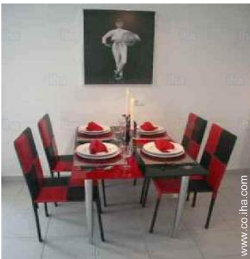
Disposición interior privado