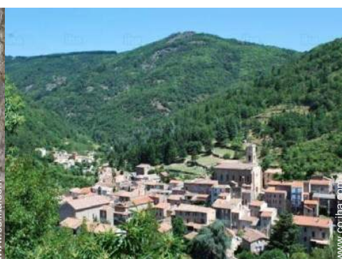
vista sobre el pueblo