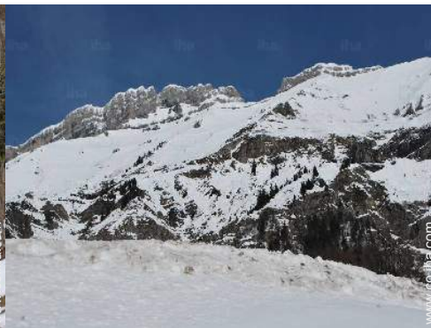
vista sobre la montaña