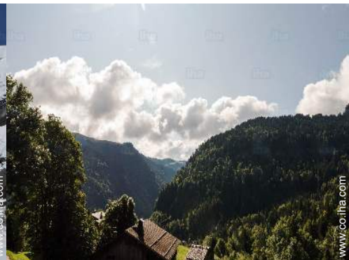
vista sobre la montaña