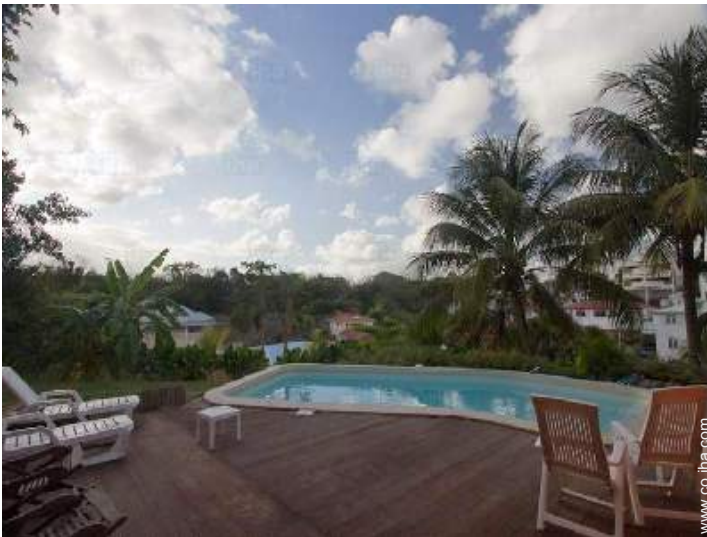
vista sobre la piscina