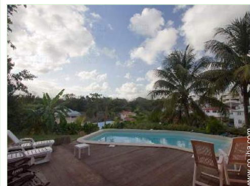
vista sobre la piscina