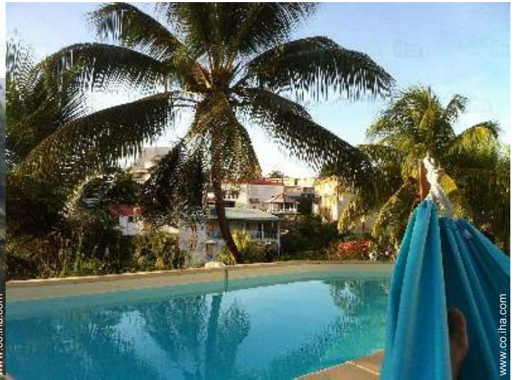
vista sobre la piscina