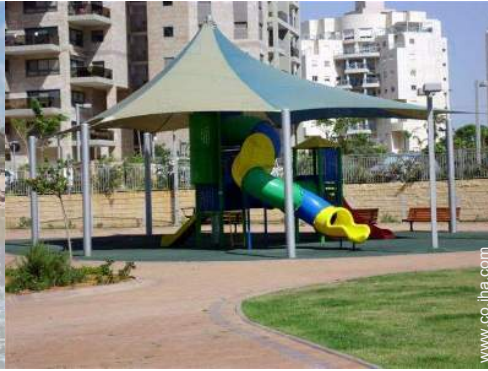
instalación de ocios