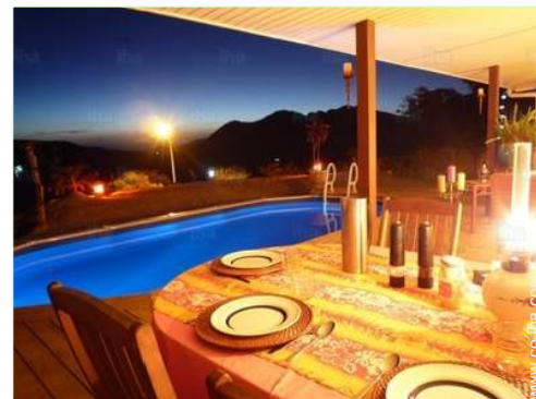
plato del día