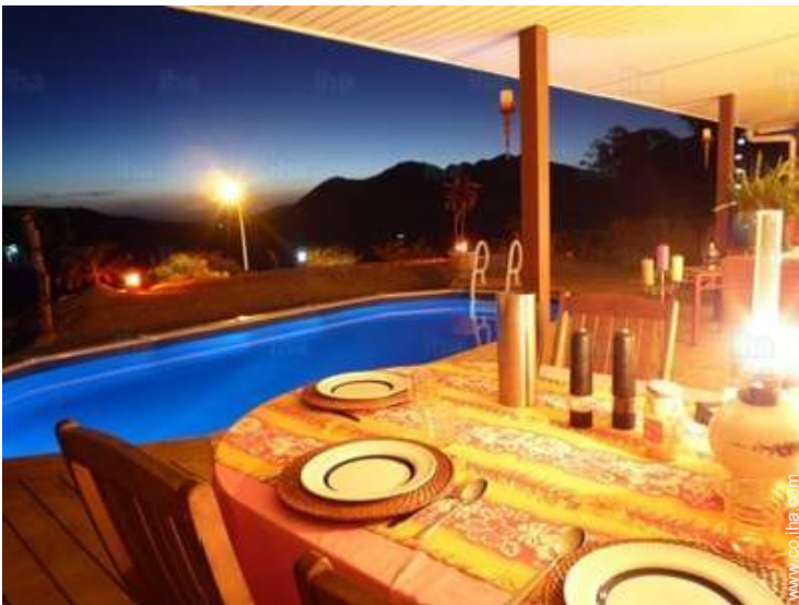
plato del día